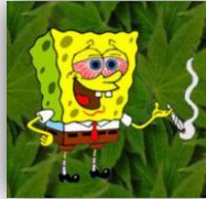
Marie et Arthur (2ASSP)

De plus en plus de jeunes fument du cannabis comme une simple cigarette ignorant les conséquences négatives de cette drogue.